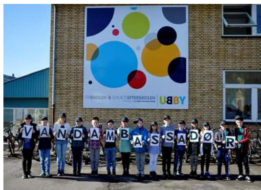
Der skal udpeges nye vandambassadører for 2017. Sidste år var det 5. klasse fra Ubby Friskole, der havde fornøjelsen.